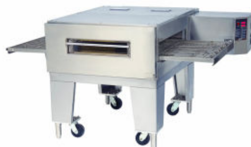
ULTRA MAX Serie