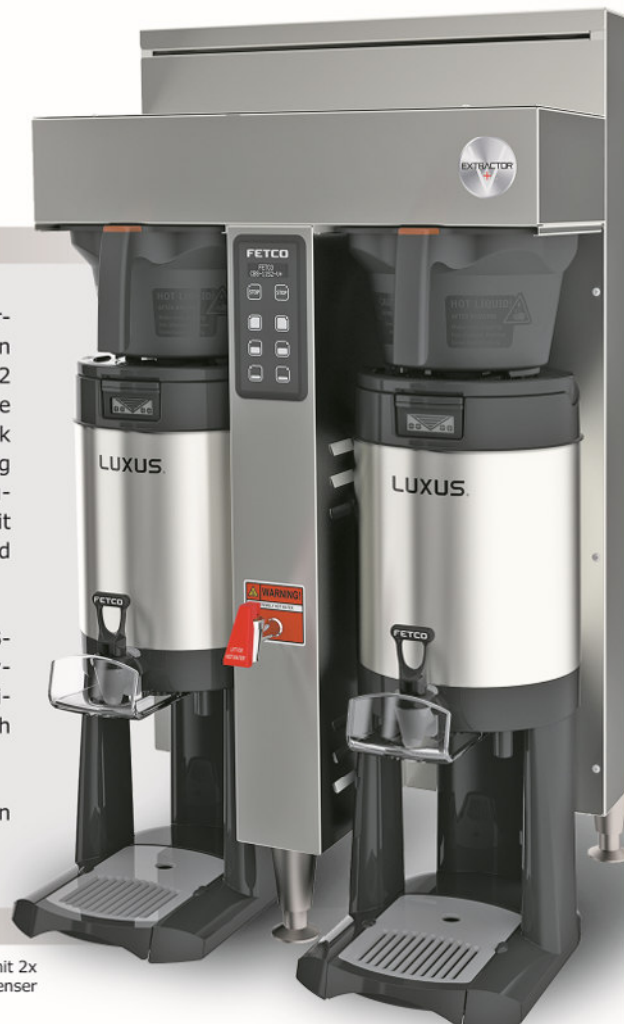
CBS-1152 V+ mit 2x 5,7l Ausgabedispenser

Brühen Sie schnell und einfach frischen Filterkaffee auf Knopfdruck.