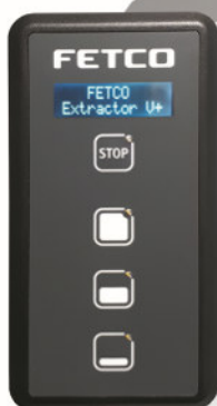
CBS-1151 V+ mit 5,7l Ausgabedispenser

Das benutzerfreundliche Bedienfeld ermöglicht Ihnen das Einprogrammieren von bis zu 3 Brühoptionen (CBS-1152 V+ bis zu 6 Brühoptionen), welche Sie mit einem einfachen Tastendruck wieder abrufen und den Brühvorgang somit starten können. Über den integrierten USB Port können Sie jederzeit Ihre programmierten Daten sichern und wiederherstellen.