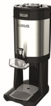
L4D-15 5,7l Thermobehälter #110121